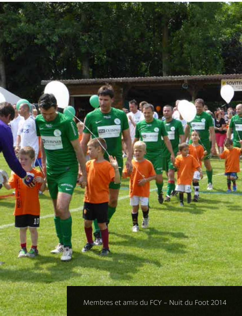
Membres et amis du FCY – Nuit du Foot 2014

Fondé en 1934 au four de la Boulangerie Delay, le club avait déjà en ses gènes ce qui allait être son ADN : chaleur et vitalité.